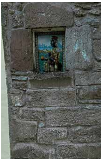
Una antiga finestra feta amb pedres del castell serví de marc a la Moreneta.