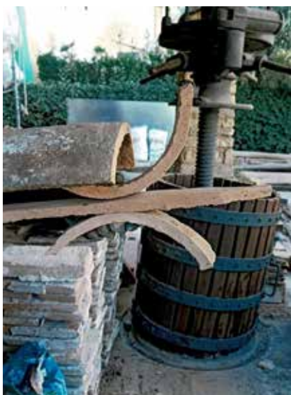
Moment de tallar i presentar l'espantabruixes.