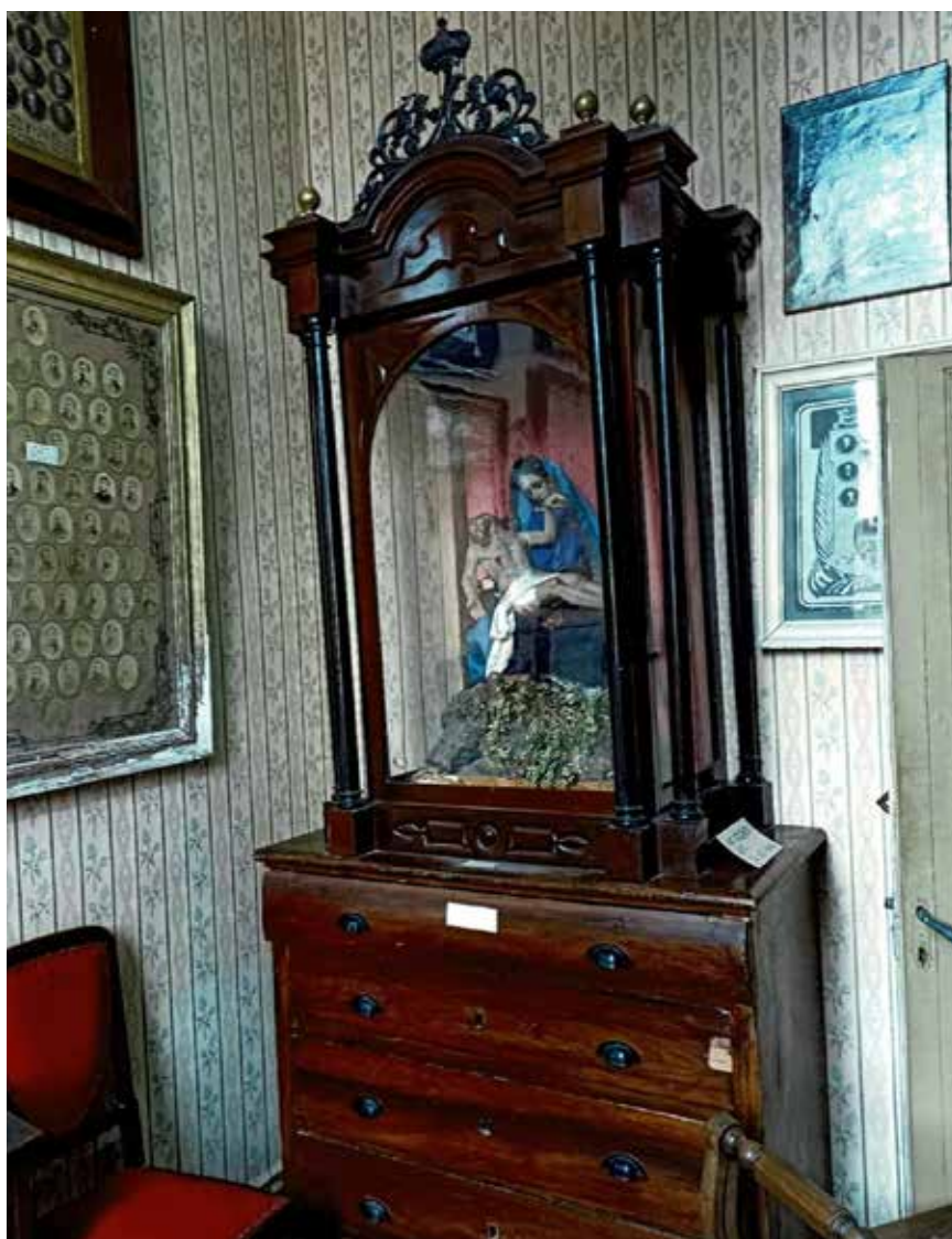
Capella de la Dolorosa o Pietat del segle XIX, isabelina. La calaixera és un dels poquíssims mobles que han arribat avui dia de les Monges.