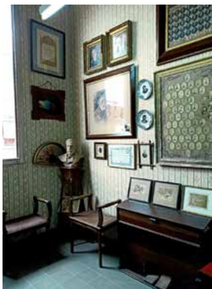
Visió parcial de la sala Doctors Galès abans de desmuntar-se.