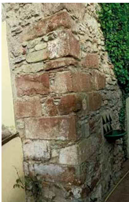
Les pedres del Castell són ben evidents a les parets de la restaurada casa Folch, a davant de cal Vador dels Tarongers.