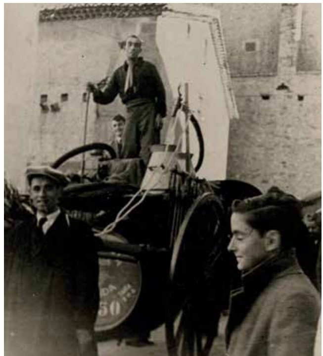
La Gelida dels anys cinquanta era eminentment pagesa i la festa dels Tres Tombs, per Sant Antoni, al gener, era una gran celebració en el fred de l'hivern.