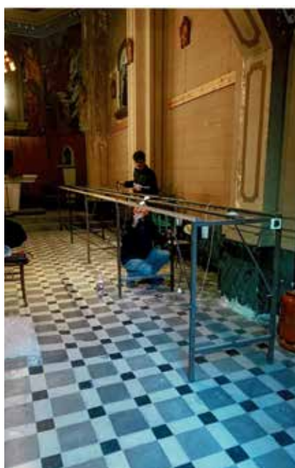
Miquel Aguilera i son fill endreçant definitivament l'interior de la capella de les Monges.