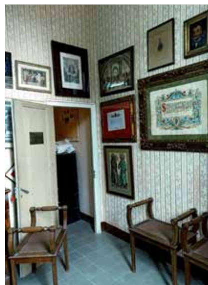
Confiem en una bona recol·locació als nous espais de les Monges, tot esperant, si escau, la definitiva a la nova bibliotecaarxiu.