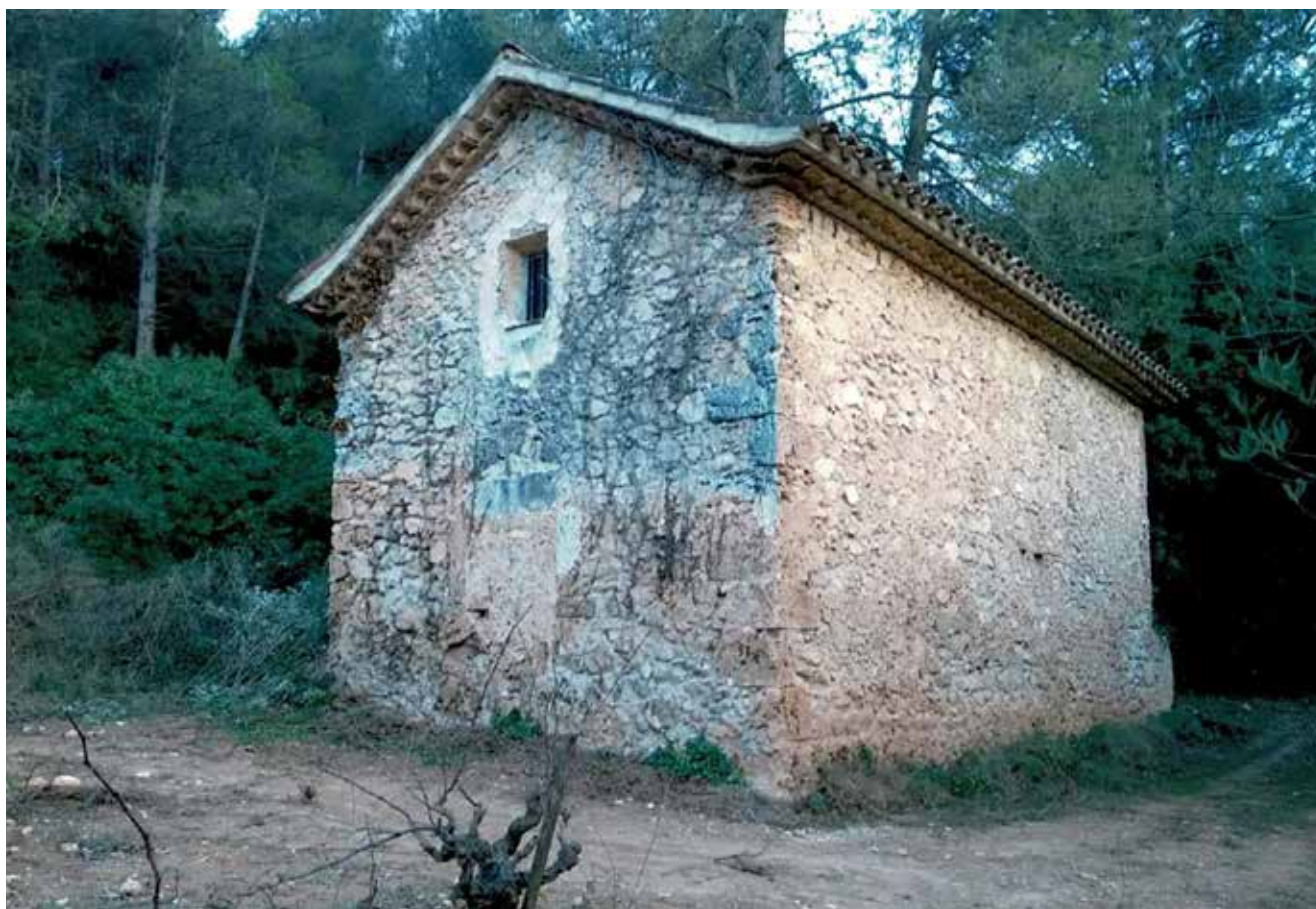
: L'heura es menjava la teulada de la projectada capella.