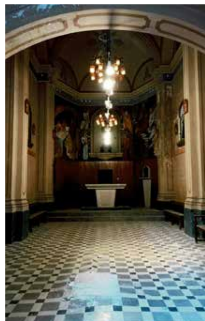
La nau, neta i endreçada.

de fer per les obres de restauració i transformació de les Monges actualment en curs de la mà de la regidora de Cultura i l'equip de govern. Confiam que al nou edifici remodelat es trobarà un espai per exhibir adequadament aquesta valuosa col·lecció mentre arribi a, si escau, la seva possible ubicació definitiva a la nova biblioteca arxíu.