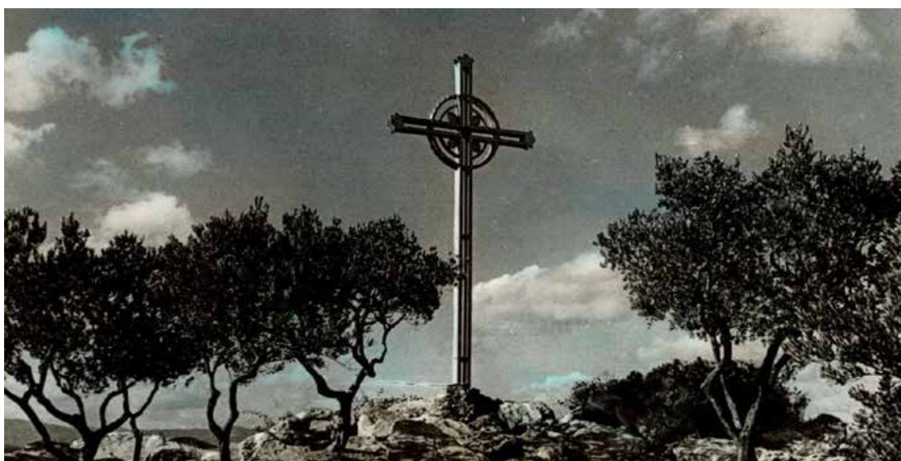
Visió històrica de la Creu vers els anys seixanta del segle passat.

C om ja fa una pila d'anys, seguim en el camí de l'activisme cultural, la recerca, la recollida constant d'informació i materials museístics i posant el nostre fons i coneixements a disposició de particulars o d'organismes oficials.