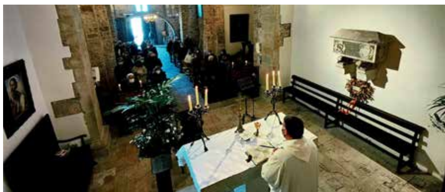
La Diada de Sant Pau tornà a Sant Pere del Castell.

Després de més d'un any d'aturada per la pandèmia, el 30 d'octubre van tornar les visites guiades al campanar i al museu parroquial cada darrer dissabte de mes, prèvia inscripció al 600 377 911. Inaugurat el 2011, el conjunt consta de més de 75 peces que formen el tresor parroquial, algunes de salvades de la Guerra Civil i d'altres d'incorporades a partir del 1939 i també d'altres donacions. Tot el conjunt es presenta a la sagristia del Santíssim, edifici construït el 1929 per l'arquitecte Isidre Puig Boada, deixeble d'Antoni Gaudí, al costat del