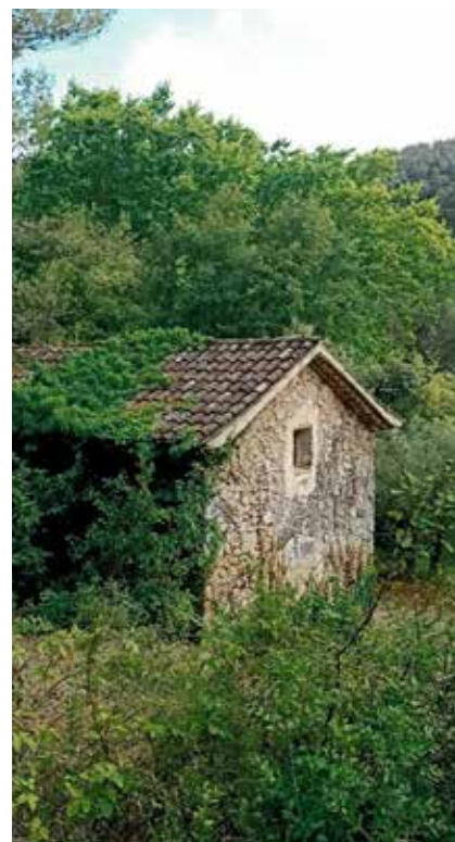
Feina feta a teulada i parets. Esperem que a partir d'ara la propietat en tindrà cura atès el seu significat històric i arquitectònic.

L'agost del 2021, veient-ne l'estat deplorable i tement el pitjor per no actuar-hi la propietat, l'anomenat Escamot cultural hi arrencà la gran quantitat d'heures i malesa que n'estaven destruint la teulada i les parets, tot esperant que el propietari sigui sensible a la restauració, atès que és un element significatiu de la finca i que no requerirà una gran inversió.