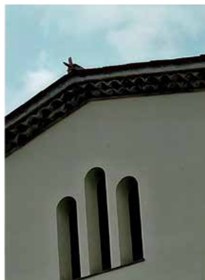
L'espantabruixes ja llueix al carener de cal Rius, tot conservant la tradició.

blicats en aquest Programa (2015), ens parlava d'uns curiosos elements posats al centre dels careners de les nostres teulades, anomenats espantabruixes , col·locats com a elements « protectors » de les cases per allunyar els mals esperits sorgits de les creences populars. Simplement eres uns trossos de teula treballats en forma de flor o espigall.