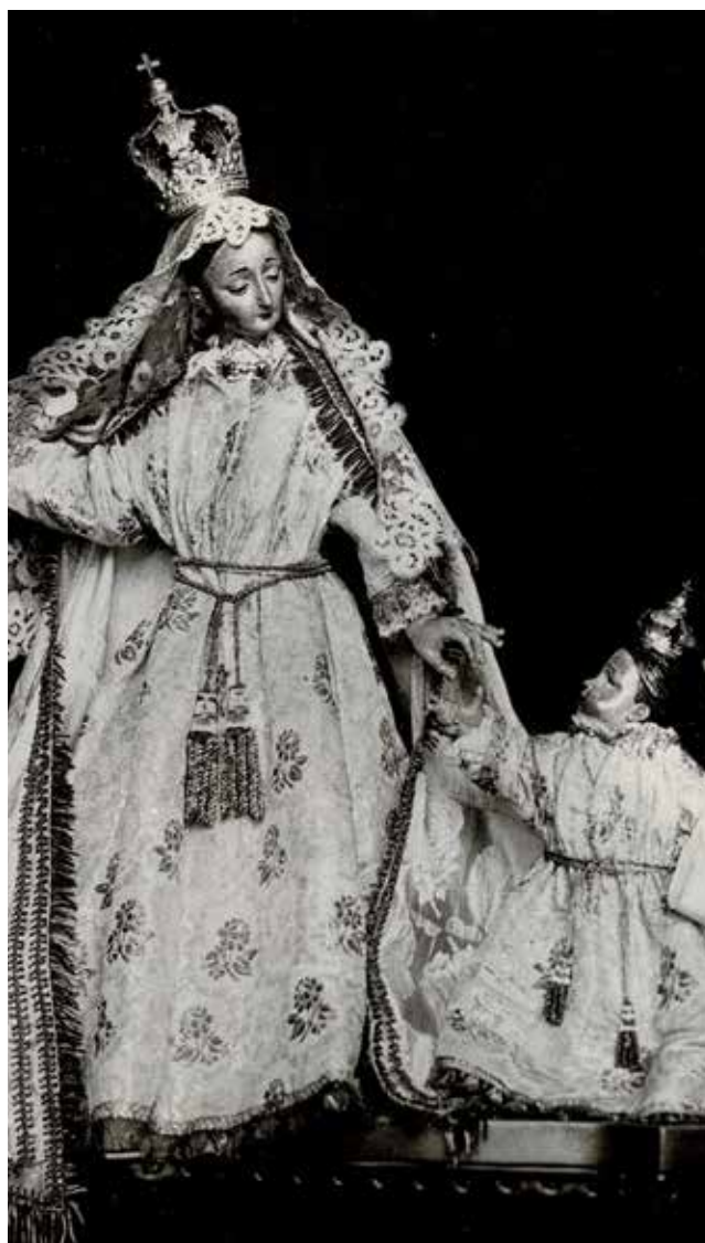
Exquisida talla barroca de la Mare de Déu de la Salut. Gelida, 1933.