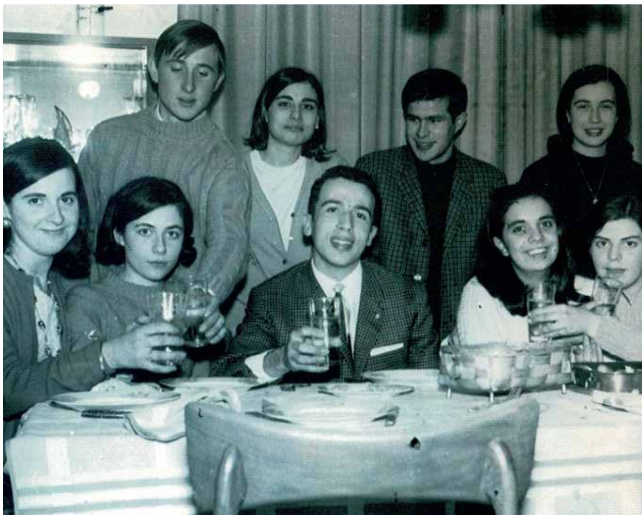
La bellesa i jovesa d'un conegut grup de gelidencs celebrant el Cap d'Any del 1967.