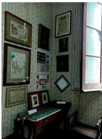
Un lloc exquisit que molts gelidencs desconeixen.