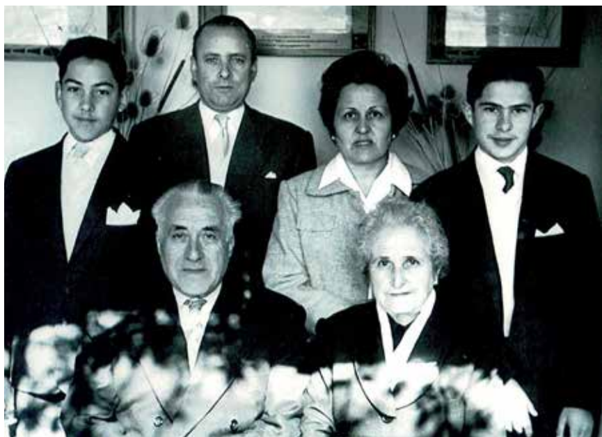
El poeta i escriptor Jaume Vila i la seva família, primavera del 1962.

l'edat de 101 anys. Única hereva del poeta i escriptor (1890-1969) sempre va conservar el llegat del seu pare, que va donar a la Biblioteca que porta el seu nom l'any 2006. El fons està format per una trentena de volums de poesia inèdita, escrits diversos, àlbums fotogràfics, reculls de premsa, lletres de cançons amb música (rescatades i estudiades pel seu besnet, Josep M. Comajunco-sas Nebot, el 1998) i publicacions diverses d'una importància literària i cultural notòria. Cal recordar una vegada més que Jaume Vila va deixar una obra literària extensa i prolífica. Es tracta d'una producció viva, fresca, que retrata magistralment els paisatges, les persones, els monuments, els sentiments, els racons i els costums de Gelida i de molts indrets del país, i que estant